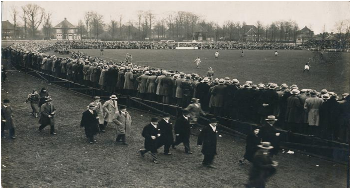
1929-1930. Beslissingswedstrijd kampioen 1e klas